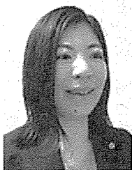
企業ウェブサイトにや雑誌などへの執筆、講演多数。

特定社会保険労務士。約8年半、IT企業でシステム開発に従事した後、社会保険労務士として開業。現在は前職の経験を活かしながら、企業の制度設計や働きやすい組織作りの支援を行っている。